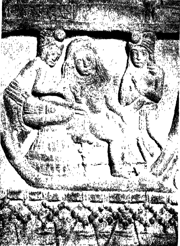
मखादेव जातक (६)